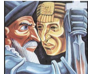
Pizarro und Atahualpa (Peru 1532)

Da in diesem Jahr weiterhin das Erzählen in der Vergangenheit ein wichtiges Thema ist, werden inhaltlich die Eroberung Perus oder Barcelona früher und heute behandelt. Besonders beliebt bei den Schülern sind auch spanische Legenden und Märchen und Musikstile aus der spanischsprachigen Welt . Aber auch